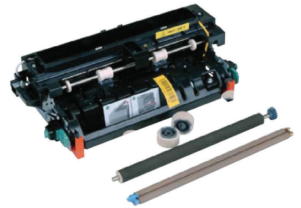
Zestaw konserwacyjny grzałki utrwalającej Lexmark T65x